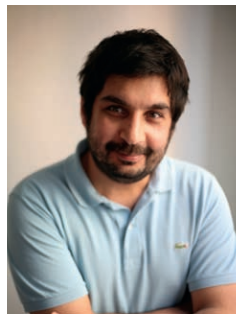
MAHMUT F. COSKUN

Το ντεμπούτο του σκηνοθέτη Μαχμούτ Φαζίλ Τζοσκούν είναι η ιστορία ενός ανεκπλήρωτου έρωτα που ενώ εκκινεί από τα εμπόδια που θέτουν οι διαθησκευτικές διαφορές, εν τέλει ανοίγεται στην υπαρξιακή σφαίρα. Η ταινία απέσπασε «Χρυσή Τίγρη» στο Ρότερνταμ.