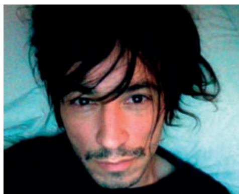
ALEXIS DOS SANTOS

Η νέα ταινία του Αλέξης Ντος Σάντος διαθέτει αξιοθαύμαστη ζωντάνια, φρεσκάδα, λυρισμό και αυθορμητισμό, ενώ ξεναγεί τον θεατή στο πολυπολιτισμικό Λονδίνο, θέτοντας ερωτήματα σχετικά με τη μνήμη, την ταυτότητα και τον ελεύθερο από συμβάσεις έρωτα.